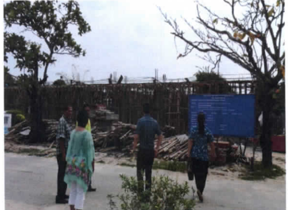
โครงการก่อสร้างอาคารเรียนโรงเรียนโคกขี้หนอน อำเภอพานทอง งบประมาณ 6,700,000 บาท โครงการอยู่ระหว่างดำเนินการ