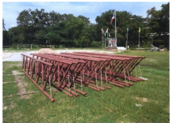
โครงการก่อสร้างอาคารอเนกประสงค์โรงเรียนสุรศักดิ์วิทยา อําเภอสรีราชา งบประมาณ 6,000,000 บาท โครงการอยู่ระหว่างดำเนินการ