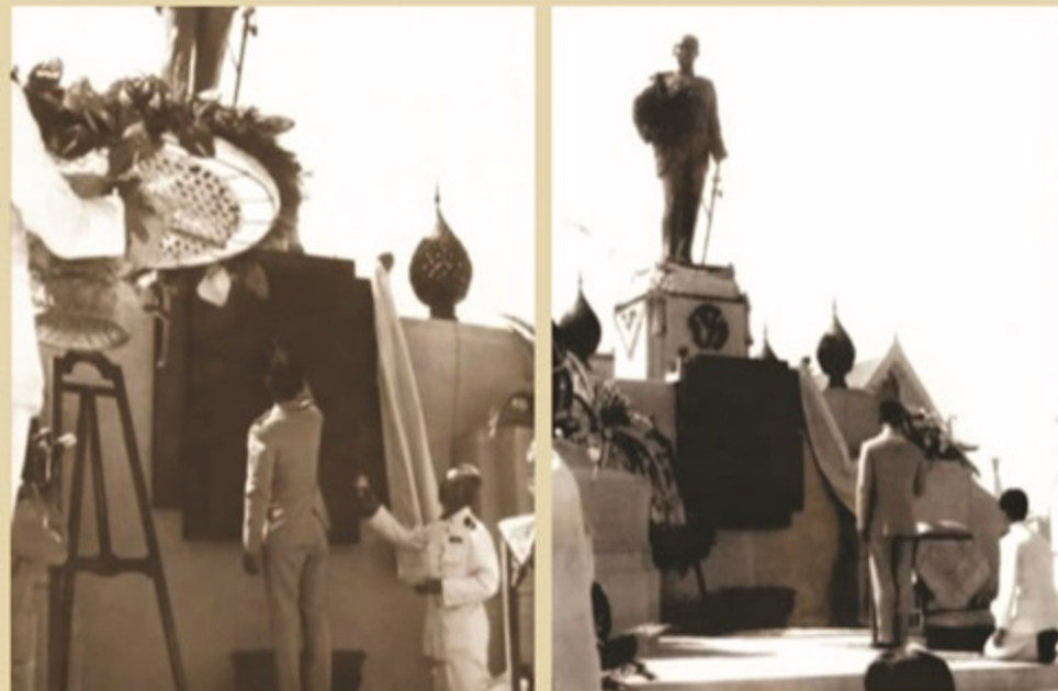
พระบาทสมเด็จพระปรมินทรมหาภูมิพลอดุลยเดช เสด็จพระราชดำเนิน ทรงกระทำพิธีเปิด พระบรมราชานุสาวรีย์ พระบาทสมเด็จพระจุลจอมเกล้าเจ้าอยู่หัว ณ บริเวณหน้าศาลากลาง จ.ชลบุรี วันที่ 15 พฤศจิกายน พ.ศ. 2500