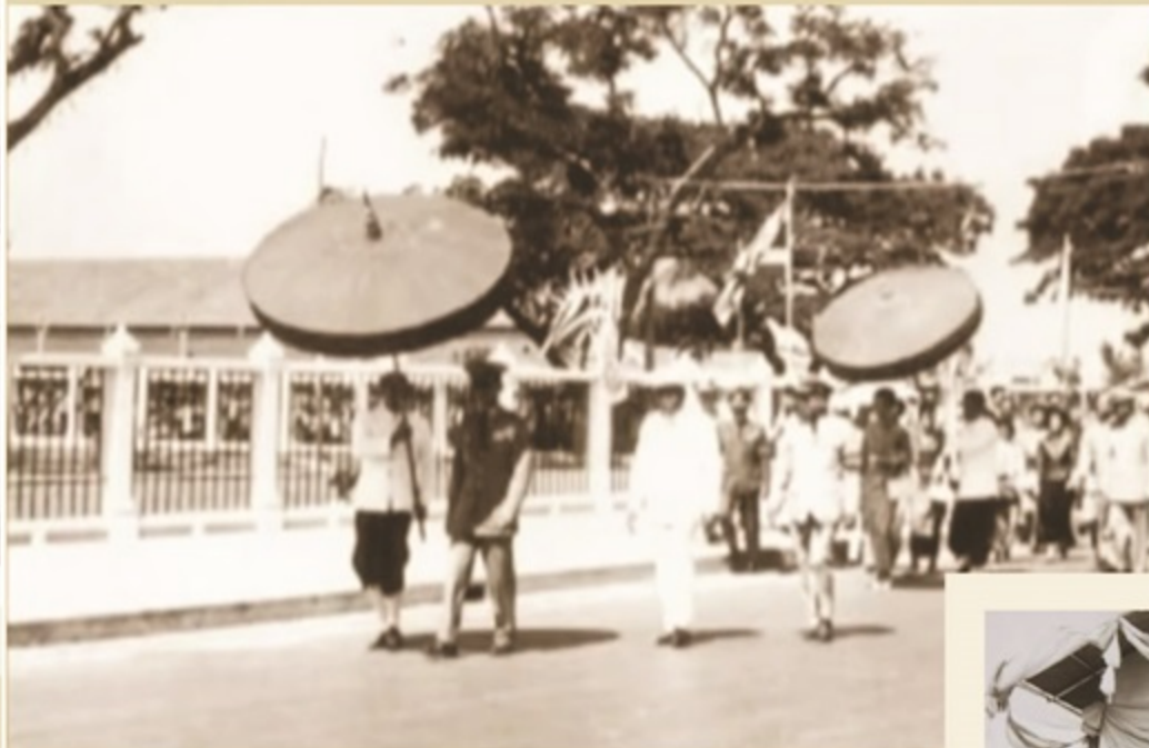
พระบาทสมเด็จพระปรมินทร มหาภูมิพล อดุลยเดช พร้อมด้วยสมเด็จพระนางเจ้า พระบรมราชินีนาถ เสด็จทรงเปิดหอพระพุทธสิหิงค์ชลบุรี เมื่อวันเสาร์ที่ 8 มกราคม พ.ศ. 2509