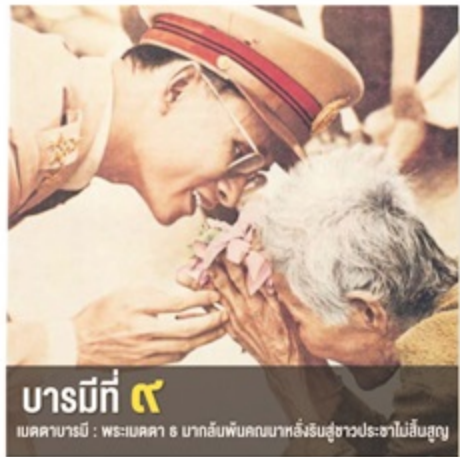
บารมีที่ ๙ เมตตาบารมี : พระเมตตา ๘ มากลับพันคนมาทักถึงประชาชนไม่สิ้นสุด

เมตตาบารมี คือ ความมีจิตเมตตาปรารถนาสุข ดับโทสะพยาบาทประกอบด้วยรักใคร่ ความปรารถนาดีและความคิดเกื้อกูลให้สรรพสัตว์ทั้งหลายมีความสุขความเจริญ