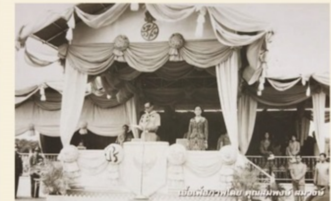
พระบาทสมเด็จพระปรมินทรมหาภูมิพลอดุลยเดช เสด็จ พระราชดำเนินมาทรงเป็นองค์ประธาน เปิดงานลูกเสือแห่งชาติ ณ ค่ายลูกเสือวชิราวุธ อ.ศรีราชา จ.ชลบุรี เมื่อวันที่ 11 ธันวาคม 2512 โดยมีพระบรมราโชวาท "ในบ้านเมืองนั้น มีทั้งคนดีและคนไม่ดี ไม่มีใครจะทำให้ทุกคนเป็นคนดีได้ทั้งหมด การทำให้บ้านเมืองมี ความปกติสุขเรียบร้อยจึงมิใช่การทำให้ทุกคนเป็นคนดี หากอยู่ที่ การส่งเสริมให้คนดีได้ปกครองบ้านเมือง และควบคุมคนไม่ดีไม่ให้ มีอำนาจไม่ให้เกิดความเดือดร้อนวุ่นวายได้"