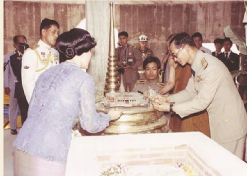
เมื่อวันที่ 30 เมษายน พ.ศ. 2525 พระบาทสมเด็จพระปรมินทรมหาภูมิพลอดุลยเดช พร้อมด้วยสมเด็จพระนางเจ้า พระบรมราชินีนาถ และ สมเด็จพระบรมโอรสาธิราชฯ สยามมกุฎราชกุมาร ทรงวางศิลาฤกษ์ก่อสร้าง พระบรมธาตุเจดีย์มหาจักรีพิพัฒน ณ วัดญาณสังวรารามวรมหาวิหาร อำเภอบางละมุง จังหวัดชลบุรี