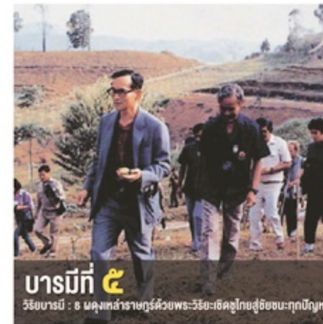
บารมีที่ ๕ วิริยบารมี : ๘ มลฑลล้าราชกูร์ด้วยพระ-วิริยะธิดอุไทยสู้อิทธิชนะทุกปิกฤท

วิริยบารมี คือ ความเพียร ความพยายาม ความกล้าที่จะลงมือทำ ภาวะของผู้กล้า ที่เป็นแนวทางให้ดำเนินไปสู่ความสำเร็จตามประสงค์ รวมทั้งหมายถึง การลงมือปฏิบัติลงมือทำงาน ที่ตนชอบที่ตนรัก ทำด้วยความพากเพียรพยายาม ทำด้วยความสนุก กล้าหาญ กล้าเผชิญความ ทุกข์ยาก ปัญหา และอุปสรรคที่จะเกิดขึ้น