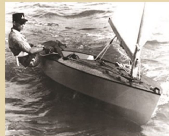
วันที่ 19 เมษายน พ.ศ. 2509 พระบาทสมเด็จพระปรมินทรมหาภูมิพลอดุลยเดช ทรงนำธง "ราชनावิกโยธิน" จากหน้าพระราชวังไกลกังวล อำเภอหัวหิน จังหวัดประจวบคีรีขันธ์ ตั้งแต่เวลา 04.00 น. ข้ามอ่าวไทยไปยังอ่าวสัตหีบ จังหวัดชลบุรี ซึ่งมีระยะทางประมาณ 60 ไมล์ทะเล ด้วยพระองค์เองพระองค์เดียว ทรงใช้เวลาในการเล่นไปถึง 17 ชั่วโมงเต็ม