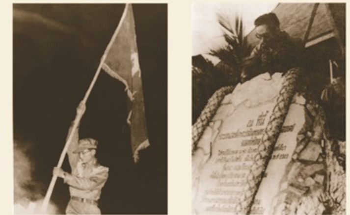
วันที่ 19 เมษายน พ.ศ. 2509 พระบาทสมเด็จพระปรมินทรมหาภูมิพลอดุลยเดช ทรงนำธง "ราชनावิกโยธิน" ซึ่งทรงนำข้ามอ่าวไทยมาด้วยปีกเหนียวอดก้นหินใหญ่ที่ชายหาดของอ่าวเตยงาม อำเภอสัตหีบ จังหวัดชลบุรี ในขณะที่วงดนตรีบรรเลงเพลงพระราชนิพนธ์มาร์ช "ราชनावิกโยธิน" หลังจากทรงปักธง "ราชनावิกโยธิน" แล้วทรงลงพระปรมาภิไธยบนแผ่นศิลาจารึก ข้อความถวายสดุดีแด่พระองค์ท่าน และประทับอยู่ท่ามกลางข้าราชการทหารและครอบครัวนาวิกโยธินตลอดจนผู้มีเกียรติทั้งหลาย