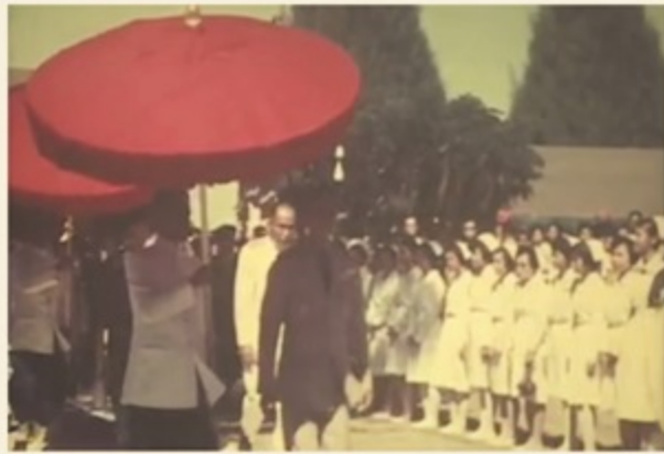
พระบาทสมเด็จพระปรมินทรมหาภูมิพลอดุลยเดช ทรงเสด็จพระราชดำเนินเปิดตึก "ซลาทร" และวางศิลาฤกษ์ตึก "ซลาทิส" ณ โรงพยาบาลชลบุรี เมื่อวันที่ 2 ธันวาคม พ.ศ. 2510