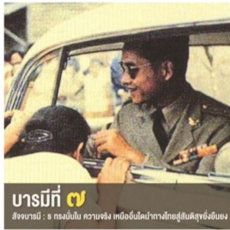
บารมีที่ ๗ สัจจบารมี : ๘ ทรงขับไล่ ความจริง เหมือนอินโดนีเซียที่ถูกล้อมด้วยขีปนาวุธ

สัจจบารมี คือ ความจริง “สัจจะ” แปลว่า ความสัตย์ ความซื่อ ถ้าขยายความตามศัพท์แยกได้ 3 ลักษณะ คือ ความจริง ความตรง และความแท้จริง