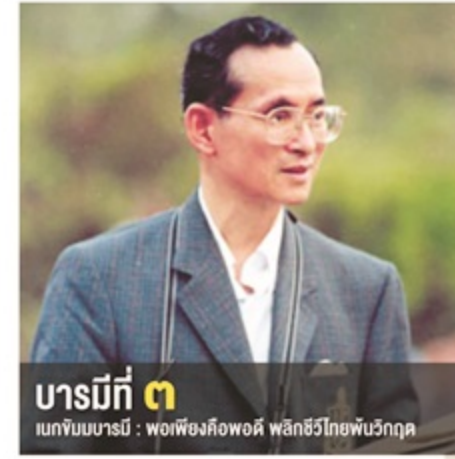
บารมีที่ ๓ เนกขัมมบารมี : พอเพียงคือพอดี พลิกชีวิตไทยพ้นวิกฤต

สืบเนื่องจากเมื่อวันพฤหัสบดีที่ 13 ตุลาคม 2559 เวลา 15.52 น. พระบาทสมเด็จพระปรมินทรมหาภูมิพลอดุลยเดช ได้ทรงเสด็จสวรรคต ณ โรงพยาบาลศิริราช ด้วยพระอาการสงบ สิริพระชนมพรรษาปีที่ 89 และทรงครองราชย์สมบัติได้ 70 ปี องค์การบริหารส่วนจังหวัดชลบุรี จึงได้จัดพิธีดังกล่าวขึ้นเพื่อเป็นการน้อมรำลึกถึงพระมหากรุณาธิคุณแห่งองค์พระบาทสมเด็จพระปรมินทรมหาภูมิพลอดุลยเดช ที่ทรงมีต่อพสกนิกรชาวไทย สร้างความร่มเย็นเป็นสุขแก่อาณาประชาราษฎร์ และประเทศชาติอย่างอนงอนันต์