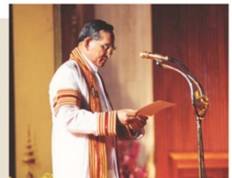
บารมีที่ ๖ ขันติบารมี : ขันติธรรม ๘ ยอดยิ่งเป็นบึงขวัญบำรุงไทย

ตัวอย่างพระจริยาวัตรที่แสดงถึงพระขันติบารมีของพระบาทสมเด็จพระปรมินทรมหาภูมิพล อดุลยเดช เช่น การที่ประทับพับเพียบได้เป็นเวลานาน หรือการพระราชทานปริญญาบัตรแก่ ผู้สำเร็จการศึกษาในสถาบันการศึกษาระดับอุดมศึกษาทั่วประเทศไทย ประทับบนพระเก้าอี้ติดต่อกัน ยาวนาน 2-3 ชั่วโมง