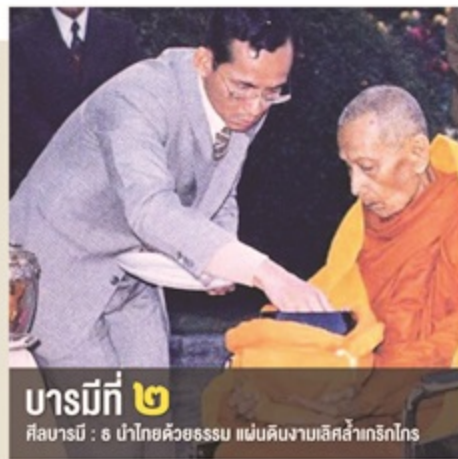
บารมีที่ ๒ ศีลบารมี : ๒ นำไทยด้วยธรรม แขนบคตินงามเลิศล้ำกรีกไกร

พระบาทสมเด็จพระปรมินทรมหาภูมิพลอดุลยเดชทรงเป็นธรรมราชาผู้ประเสริฐยิ่งในฐานที่ทรงยึดมั่นในหลักทศพิธราชธรรม ซึ่งเป็นศีลธรรมของพระราชอาหรือผู้ปกครองที่มีความเคร่งครัดมากกว่าศีลธรรมของคนทั่วไป