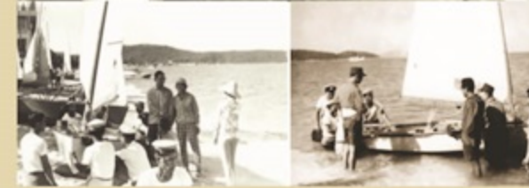
เมื่อวันที่ 16 ธันวาคม พ.ศ. 2510 พระบาทสมเด็จพระปรมินทรมหาภูมิพลอดุลยเดช พร้อมด้วยทูลกระหม่อมหญิงอุบลรัตนราชกัญญาสิริวัฒนาพรรณวดี ทรงเข้าร่วมการแข่งขันกีฬาแหลมทอง ครั้งที่ 4 (ภายหลังจึงได้เปลี่ยนชื่อเป็นกีฬาซีเกมส์) จนทรงได้รับชัยชนะในการแข่งขันเรือใบประเภท โอ.เค. ณ สนามแข่งขันเรือใบอ่าวพัทยา อำเภอบางละมุง จ.ชลบุรี ในฐานะนักกีฬาเรือใบ ประเภท โอเค ของประเทศไทย โดยพระบาทสมเด็จพระเจ้าอยู่หัวทรงครองเหรียญทองร่วมกับทูลกระหม่อมหญิงอุบลรัตนราชกัญญาสิริวัฒนาพรรณวดี นับเป็นพระมหากษัตริย์พระองค์แรกในทวีปเอเชียที่สามารถครองรางวัลชนะเลิศ ในการแข่งขันและเป็นที่ยอมรับในวงการกีฬาเรือใบระดับโลก