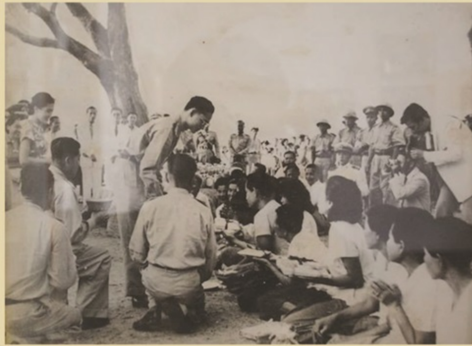
เมื่อวันที่ 25 กุมภาพันธ์ พ.ศ. 2497 พระบาทสมเด็จพระปรมินทรมหาภูมิพลอดุลยเดช พร้อมด้วยสมเด็จพระนางเจ้าพระบรมราชินีนาถ เสด็จเยือนอ่างศิลา โดยมีราษฎรตำบลอ่างศิลา และใกล้เคียง รวมทั้งข้าราชการชั้นผู้ใหญ่ ของจังหวัดเฝ้ารับเสด็จ ณ บริเวณต้นมะขามคู่ต้นใหญ่ หน้าพระตำหนักราชินี