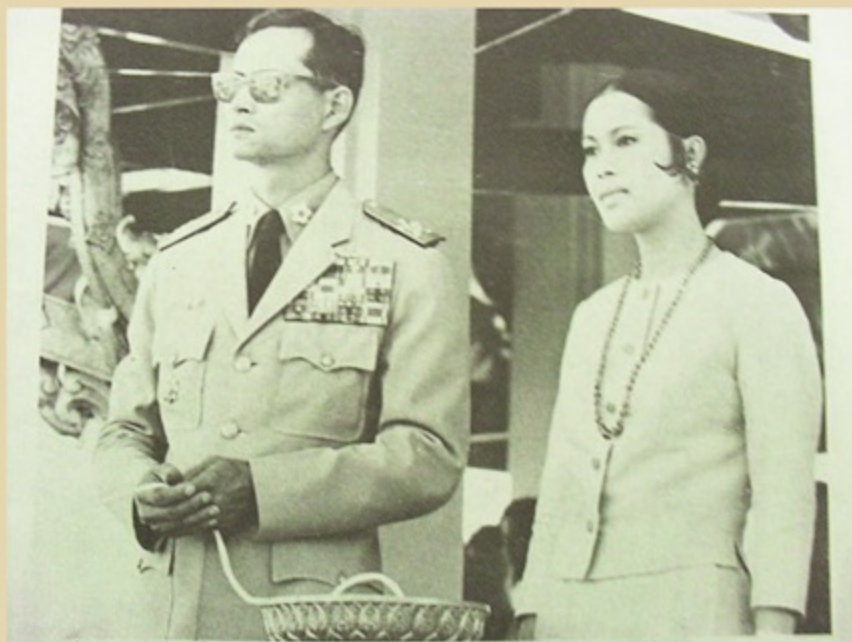
วันที่ 9 ธันวาคม พ.ศ. 2508 พระบาทสมเด็จพระปรมินทรมหาภูมิพลอดุลยเดช เสด็จพระราชดำเนินไปวิทยาลัยเผยแผ่ พระพุทธศาสนา อำเภอบางละมุง จังหวัดชลบุรี ทรงเปิดอาคารอุดมพุทธศาสตร์ ทรงยกช่อฟ้า ทรงเปิดตึกหอพักนักเรียนบพ และทรงเททองหล่อ พระประธานพระพุทธสิลา ณ วิทยาลัยเผยแผ่พระพุทธศาสนา อำเภอบางละมุง จังหวัดชลบุรี