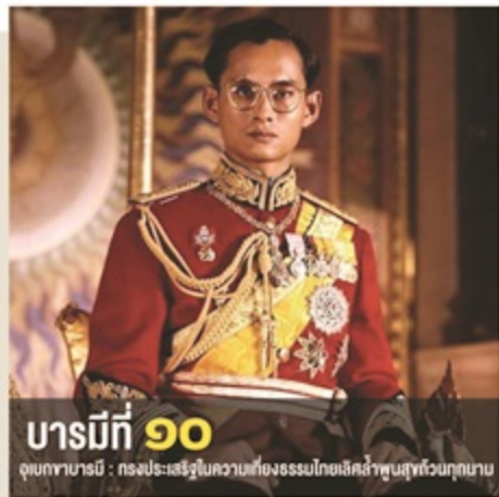
บารมีที่ ๑๐ อุเบกขาบารมี : ทรงประเสริฐในความเที่ยงเสมอไทยเลิศล้ำพ้นทุกวงกบ

พระบาทสมเด็จพระปรมินทรมหาภูมิพลอดุลยเดช ทรงวางพระองค์ไว้อย่างคงที่ ไม่มีความเอนเอียงหวั่นไหวเพราะถ้อยคำที่ตี-ร้าย ลากลักการะ หรืออารมณ์ชั่วขณะใดๆ ทรงดำรงมั่นในความยุติธรรม ความเที่ยงธรรม ไม่ทรงประพฤติกเล็ดเคลื่อนวิบัติไป ด้วยมีพระทัยเป็นกลางคู่ควรกับฐานองค์พระประมุขของประเทศ ภายใต้ร่มพระบรมโหสิสมการ แผ่นดินไทยจึงมีความเท่าเทียมสอดคล้องกับระบอบการปกครองด้วยระบอบประชาธิปไตย