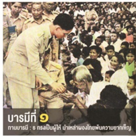
บารมีที่ ๑ ทศบารมี : ๑ ทรงเป็นผู้นำ นำเหล่าคนไทยพ้นความยากเข็ญ

ทศบารมี หรือ บารมี 10 ประการ หมายถึง ปฏิปทาอันยอดเยี่ยม คุณธรรมที่ประเสริฐปฏิบัติอย่างดียิ่งยอด คือ ความดีที่บำเพ็ญอย่างพิเศษ เพื่อบรรลุซึ่งจุดหมายอันสูงสุด หลักปฏิบัติที่ในหลวงท่านทรงใช้ในการปกครองบ้านเมือง เพื่อความสุขและสงบที่แท้จริง