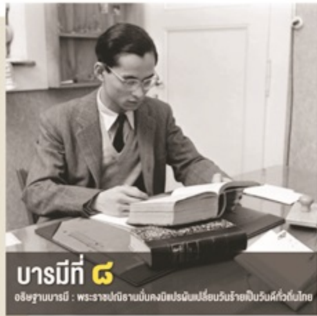
บารมีที่ ๘ อธิษฐานบารมี : พระราชปณิธานอันคงมีพระปณิธานเปี่ยมบริบูรณ์บริบูรณ์

ดังที่กล่าวไปในบารมีที่แล้ว พระบาทสมเด็จพระปรมินทรมหาภูมิพลอดุลยเดช มีพระราชเสาวนีย์ครั้งเมื่อเสด็จเถลิงถวัลยราชสมบัติ ทรงตั้งพระทัยแน่วแน่ว่าจะมีความสุขแก่มหาชนชาวสยาม อีกทั้งเมื่อครองราชสมบัติแล้วก็ทรงตั้งพระทัยทรงงานช่วยเหลือประชาชนตลอดมา เมื่อทรงตั้งพระทัยจะทำสิ่งใดแล้วจะทรงทำอย่างจริงจังและดีที่สุด