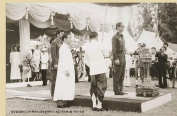
พระบาทสมเด็จพระปรมินทรมหาภูมิพลอดุลยเดช เสด็จโรงเรียน อัสสัมชัญ ศรีราชา เมื่อวันที่ 9 พฤศจิกายน พ.ศ. 2519 เสด็จ พระราชดำเนินทรงเปิดตึกวชิรสมโภชน์