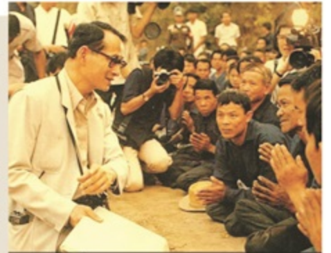
บารมีที่ ๔ ปัญญาบารมี : จอบปราศจากทั้งแผ่นดิน ภูมิกรบ่าไทยเรื่องรุ่งโรจน์

พระสติปัญญาของพระบาทสมเด็จพระปรมินทรมหาภูมิพลอดุลยเดช เกิดจากการศึกษาเล่าเรียน การศึกษาด้วยพระองค์เองและการสังเกต การฟัง และการนำมาวิเคราะห์ สังเคราะห์อย่างมีเหตุผล พระองค์ทรงได้รับการปลูกฝังและความเอาพระทัยใส่เป็นอย่างดีจากสมเด็จพระบรมราชชนนี ทำให้ทรงมีนิสัยใฝ่รู้ใฝ่เรียนมาตั้งแต่ทรงพระเยาว์