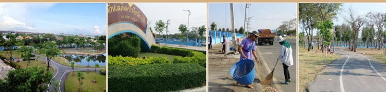
งานปรับปรุงภูมิทัศน์ สวนเฉลิมพระเกียรติราชินี 60 พรรษา 2535 อำเภอบางละมุง สร้างความเป็นระเบียบ สะอาดและสวยงาม เพื่อใช้เป็นที่พักผ่อนที่พักผ่อนและออกกำลังกายของประชาชน