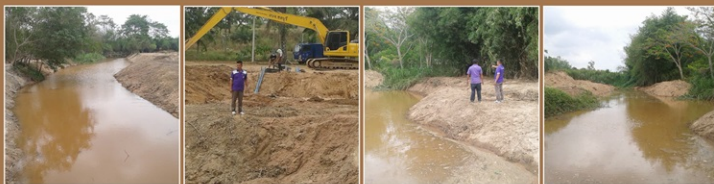
งานขุดลอกหน้าฝายหมู่ 10 เทศบาลตำบลโป่ง อำเภอบางละมุง สำหรับกักเก็บน้ำให้ประชาชนในพื้นที่ปลูก-บรีโกลช่วงฤดูแล้ง