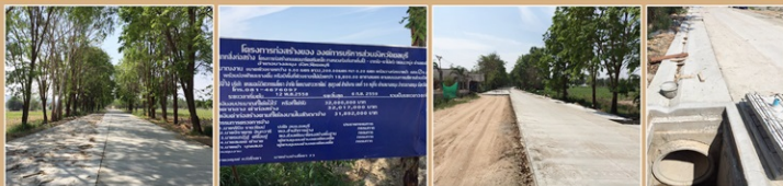
งานก่อสร้างถนนคสล.สายโรงปี-นาเกลือ-เขาไม้แก้ว ถนนถ่ายโอนเขตอำเภอบางละมุง งบประมาณ 31,892,000 บาท