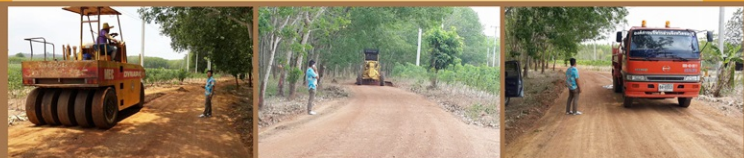
งานเกรดซ่อมถนนสายหมีทองแร่เก่า หมู่ 4 เทศบาลเมืองปรกฟ้า อำเภอกะฉะจรรย์