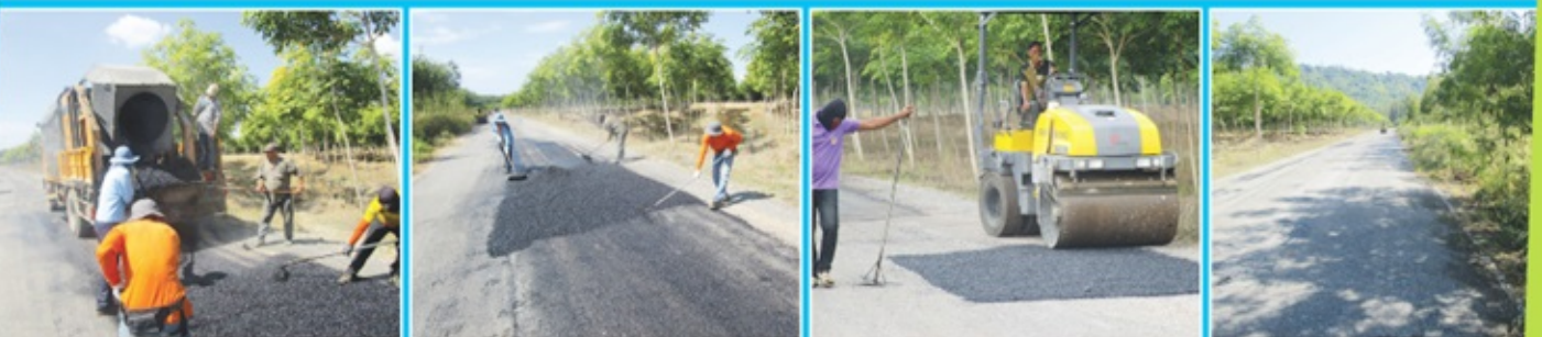
ปรับปรุงพื้นถนนสาย คลองใหญ่-คลองพลุ อำเภอหนองใหญ่