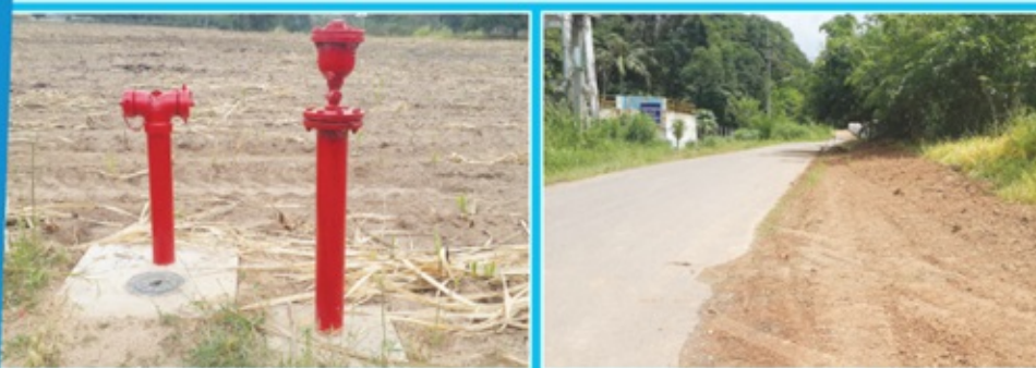
โครงการขยายเขตน้ำประปาบริเวณชุมชนบ้านหนองผักหนาม อำเภอหนองใหญ่ งบประมาณ 2,254,000 บาท