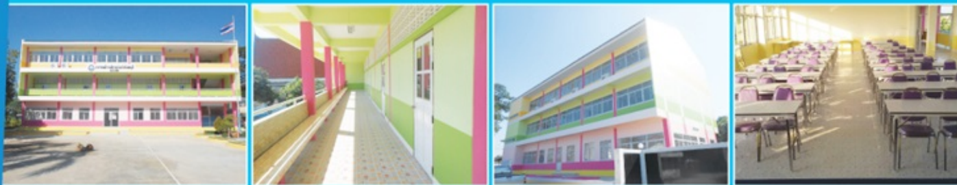
โครงการก่อสร้างอาคารเรียน โรงเรียนวัดนาพร้า อำเภอสรีราชา งบประมาณ 7,784,250 บาท