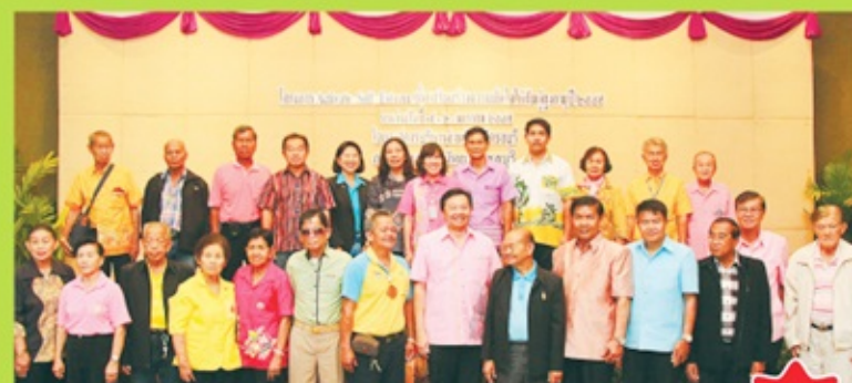
อบจ.ชลบุรีจัด โครงการ Activate Self Esteem 7