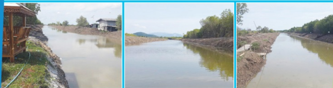
โครงการขุดลอกคลองกั้นเขต ตำบลคลองตำหรุ อำเภอเมืองชลบุรี