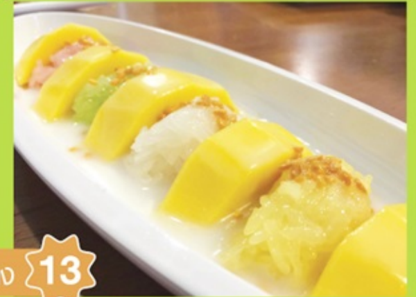
"ข้าวเหนียวมะม่วง" แวะชิมรับทาง 13