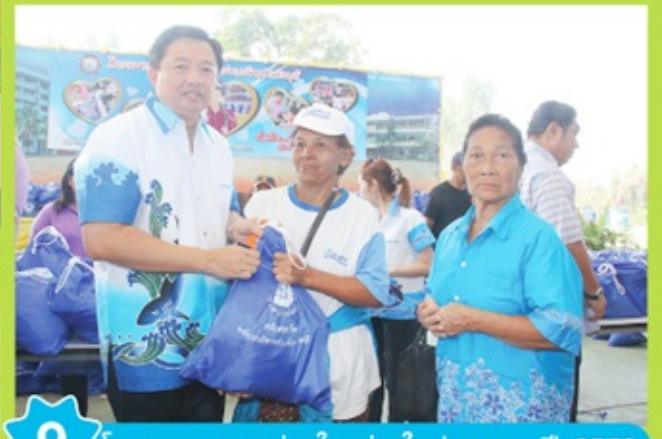
9 โครงการ อบจ.ร่วมใจ ท่องใยประเพณี ปี 2559