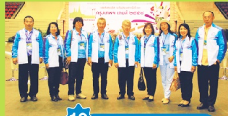
12 พิธีเปิดการแข่งขันกีฬา "กรุงเทพฯเกมส์ 2558"