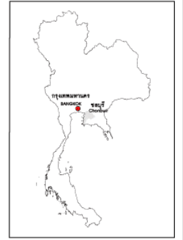
จ.ฉะเชิงเทรา Chachoengsao